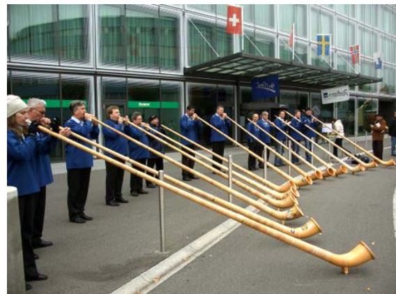
Die Alphorn-Vereinigung Pilatus-Kriens