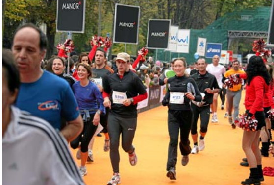
Fotograf Andy Mettler von Swiss-Image hat die schönsten Lucerne-Marathon-Momente festgehalten

Auf der Lucerne Marathon-Geschäftsstelle gibt es kein Aufschneiden. Mit dem Ende der zweiten Veranstaltung hat schon der Anfang des dritten begonnen. Laufend treffen neue Anmeldungen ein, für die nächste Auflage, vom Sonntag, 25. Oktober 2009. Zahlreicher noch sind im Moment aber die Dankes-Schreiben für das Erlebnis vom vergangenen Sonntag. „Es war genial in jeder Beziehung“ ist der Tenor. Dabei hat natürlich auch der Tenor seine Facetten, sind die Lobes-Bezeugungen ganz verschieden, treffen auch mal so ein: „Ich habe mir auf den letzten zehn Kilometern geschworen, diesen Blödsinn nie mehr zu machen – und wo genau kann ich mich jetzt anmelden?“