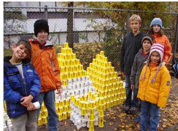
Becherburg am Geissensteinring

Viele der 800 Helferinnen und Helfer des Lucerne Marathons nutzten die Chance, auch den eigenen Nachwuchs ein bisschen Wettkampf-Athmosphäre schnuppern zu lassen. Der Nachwuchs wiederum nutzte die Gelegenheit auf seine Weise: Beim Verpflegungsposten am Geissensteinring zum Beispiel entstand durch Kinderhand eine regelrechte Becher-Burg.