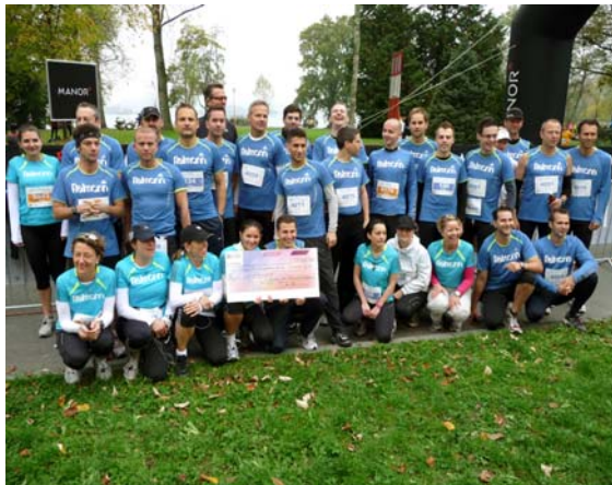
Die sportliche Fielmann-Truppe

Eine besondere Geste liessen sich die sportlichsten Angestellten der Fielmann-AG/ Johnson+Johnson einfallen. Nicht weniger als 54 Läuferinnen und Läufer setzten sich nicht nur sportlich ein, sie ermöglichten auch anderen von ihrem Marathon-Erlebnis zu profitieren. Die Stiftung für Schwerbehinderte in Rathausen, SSBL, erhielt von den Fielmännern und -frauen einen Scheck in der Höhe von 3000 Franken. Dieser soll für die Realisierung eines Ausflug-Wunsches genutzt werden.